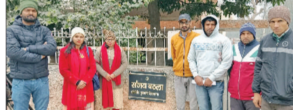
चरखी दादरी। करनाल में सीएम आवास ज्ञापन देने पहुंचे युवा।

हरियाणा विद्यालय शिक्षा बोर्ड द्वारा गत माह आयोजित एचटेट की परीक्षा में हिंदी व अंग्रेजी भाषा के 30 प्रश्न पाठ्यक्रम के बाहर होने के कारण ज्यादातर अभ्यर्थी उत्तीर्ण नहीं हो पाए। बोर्ड के इस मनमाने रवैयें को पॉलिटी के चलते युवाओं को काफी मानसिक परेशानियों से दो चार होना पड़ रहा है। इसके चलते हाल ही में हरियाणा कोशल रोजगार निगम द्वारा निकाली गई शिक्षक भर्ती तक