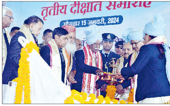
मिवाणी। द्वीप प्रज्वलित करके कार्यक्रम का शुभारंभ और विद्यार्थियों को संबोधित करते राज्यपाल बंडारू दत्तात्रेय।