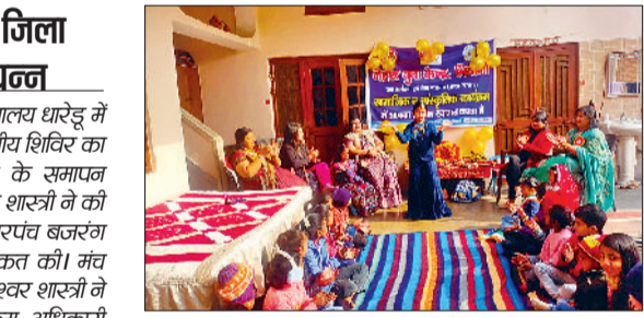
सांस्कृतिक कार्यक्रम की प्रस्तुति देते प्रतिभागी।