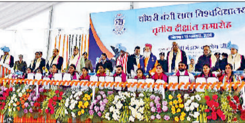
स्नातक के 6500, स्नातकोत्तर के 1544 विद्यार्थियों को डिग्री प्रदान की

का है। एक सर्वे के अनुसार 2030 तक विश्व में तीन करोड़ नए रोजगार पैदा होंगे। मुझे विश्वास है कि भारत का युवा नई तकनीक अपनाकर इनमें से दो करोड़ नौकरी अपने हिस्से में लाएगा। दीक्षांत समारोह में गोल्ड मेडल हासिल करने वाले कुल 22 में 19 छात्राएं होने पर राज्यपाल श्री दत्तात्रेय ने खुशी