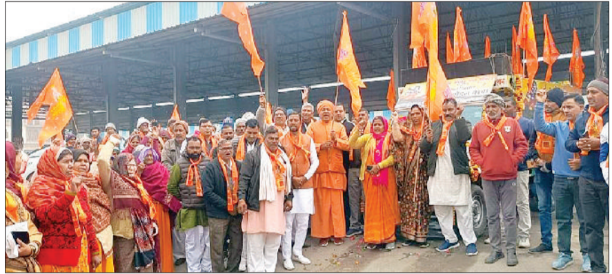
भिवानी। पदयात्रा के दौरान श्रीराम जी के जयकारे लगाते हुए।