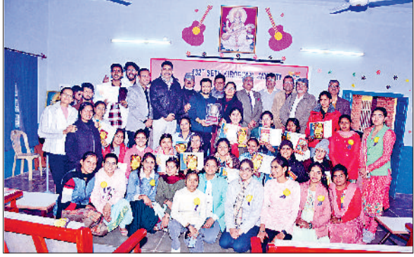
भिवानी। विजेताओं को पुरस्कृत करते अतिथि।